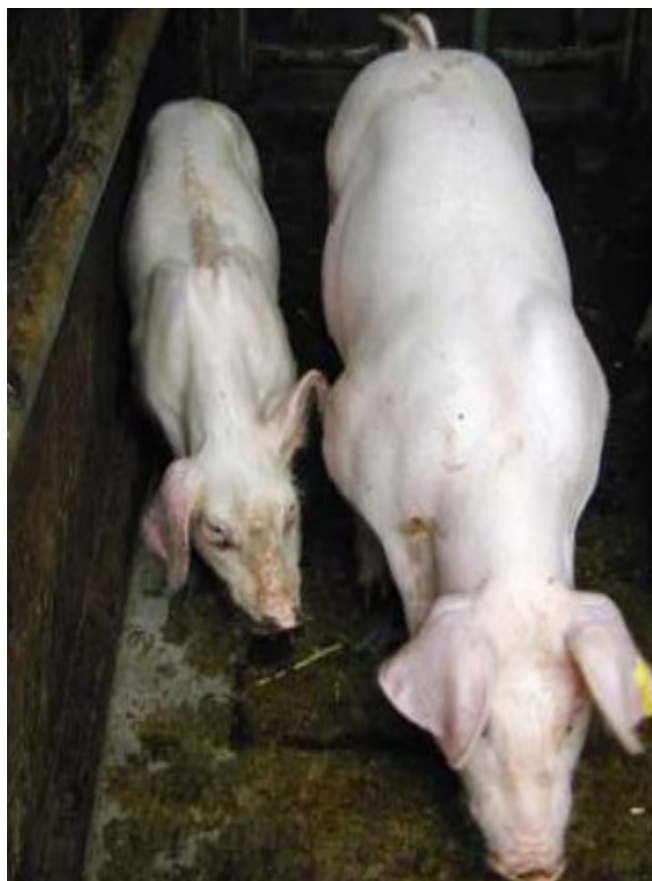
Figura 2: Suíno afetado pela SMDS (à esquerda) comparado a outro de mesma idade

A melhor forma de diminuir os prejuízos causados por estas doenças que afetam plantéis inteiros é através do manejo adequado, noções de higiene, desinfecção rigorosa da granja, redução da densidade de animais, boa nutrição, ventilação correta e obviamente, a vacinação dos animais. Pensando nisso, a Vencofarma tem agora a mais nova arma contra Circovirose suína no Brasil, a vacina Circomaster (Figura 3), que com uma única dose pode proteger os suínos diminuindo o índice de refugagem e os prejuízos causados pela doença. Também apresentou uma baixa taxa de mortalidade e alta taxa de crescimento dos leitões. A PRO-VAC Circomaster conta ainda com um novo e poderoso adjuvante: o carbopol (carbômero), que permite maior imunogenicidade da vacina, segurança na aplicação e liberação gradativa do ORF2, o que garante maior tempo de proteção com apenas uma dose em leitões sem diminuir a durabilidade de proteção. Além dessas vantagens, o carbômero utilizado na vacina não é oleoso mas a base de água, diminuindo a dor local após a aplicação.